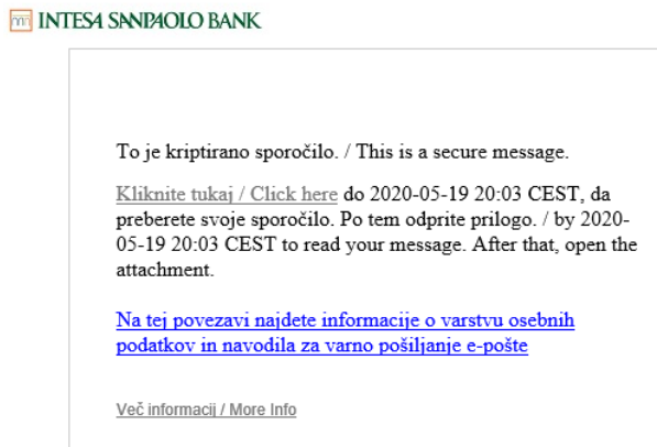
Slika 6: Obvestilo zunanjega uporabnika o prejeti šifrirani pošti

S klikom na povezavo »Kliknite tukaj/Click here« iz zgornjega obvestila se bo Uporabnik preko internetnega brskalnika povezal na z vstopno točko varnega elektronskega poštnega sistema, kjer je shranjeno to šifrirano sporočilo. V prejeti povezavi bo že naveden e-naslov Uporabnika, tako, da vnese le še svoje geslo. V primeru, da Uporabnik še ni registriran v sistem varnega pošiljanja e-pošte, se mora preko povezave v prejetem obvestilu registrirati (kakor je opisano v 2. poglavju teh navodil).