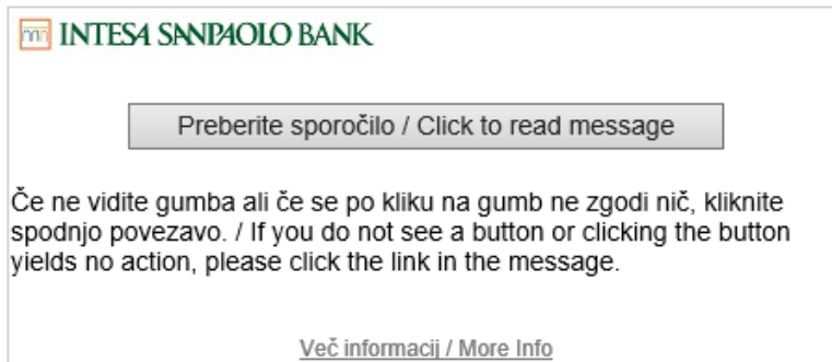
Slika 7: Odpiranje sporočila

Pravno obvestilo / Disclaimer: To elektronsko sporočilo in njegove priloge lahko vsebujejo poslovne skrivnosti in/ali zaupne podatke. Prosim Vas, da sporočila ne preberete, če niste določeni kot njegov prejemnik. Če ste to sporočilo prejeli pomotoma, obvestite njegovega pošiljatelja in uničite izvirmo sporočilo ter priloge, ne da bi jih prebrali ali shranili. Vsaka nepooblaščen uporaba, distribucija, reprodukcija ali objava tega sporočila je prepovedana. Banka Intesa Sanpaolo d. d. ni odgovorna za vsebino tega sporočila, niti za posledice, ki izhajajo iz dejanj, ki temeljijo na posredovanih informacijah, niti mnenja v tem sporočilu ne odražajo nujno uradnih mnenj Banke Intesa Sanpaolo d. d. Glede na pomanjkanje popolne varnosti elektronske komunikacije, Banka Intesa Sanpaolo d. d. ne prevzema odgovornosti za kakršno koli škodo, nastalo zaradi okužbe elektronskega sporočila z virusom ali drugim zlonamernim programom, nepooblaščenim poseganjem, napačnim ali zapoznelim pošiljanjem sporočila zaradi tehničnih težav. Banka Intesa Sanpaolo d. d. si pridržuje pravico nadzirati in shranjevati dohodna in odhodna e-poštna sporočila.